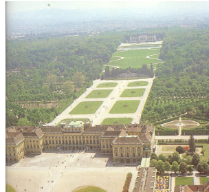
کاخ و پارک شونبرون

تئاتر کاخ شونبرون که مختص به خاندان هابسبورگ بوده است، امروزه مرکز نمایش اپراها و تئاترهای بسیار است. قنادی شونبرون شیرینی های وینی را طبق سنت قدیمی تهیه می کند.