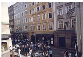
گنرایده گاسه و محل تولد موزارت

زیبایی های طبیعی و سبک های معماری شهر و حومه آن، برگزاری جشنواره ها، زادگاه موزارت بودنش، اهمیت و جاذبه ای خاص به این شهر اعطا کرده است و هر ساله تعداد بسیاری از جهانگردان را به این ناحیه می کشاند. کوچه های تنگ، قدیمی و بدون وسائل نقلیه در بافت قدیمی، کوچه «گنرایده گاسه» و محل تولد موزارت از جمله اماکن دیدنی این شهر هستند.