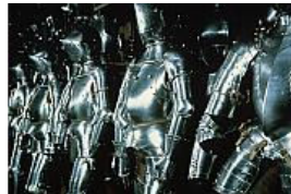
زره های تسویگ هاوز

روش زندگی در قرون وسطی برای بازدیدکنندگان «تسویگ هاوز» ۷ کاملاً محسوس است. گراتس شهری است که در آن فرهنگ و هنر بر زندگی مردم همیشه نفوذ بسیاری داشته است.