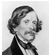
کارلو دی گگا

در سال 1841 وزیر کشور وقت «فرانتس کوپک 13 » دستور تأسیس راه آهن به «تریست» را صادر کرد. مسیری که در زمان های گذشته با واگن ها و گاری های