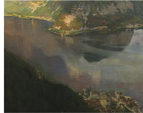
دریاچه هال شتات

علاوه بر مناظر طبیعی زیبا، کوه های مرتفع، غارها، گیاهان نادر و دریاچه های نیلگون، این منطقه دارای اماکن باستانی با قدمتی نزدیک به 2500 سال می باشد.