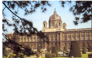
موزه تاریخ هنر

این دو موزه در منطقه یک وین بوده و کاملاً متقارن با یکدیگر قرار دارند و دارای تعدادی چند نمایشگاه دائمی می باشند و در فواصل مختلف نمایشگاه های ویژه ای همچون «هفت هزار سال شاهکارهای ایران» را ارائه می کنند.