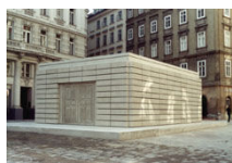
موزه میدان یهودیان

این نقطه مکان ایده آلی برای یادآوری خشونت حکومت نازی بر یهودیان است و بر روی خرابه کنیسه ای از قرون وسطی و به آن یاد بود ساخته شده است. بر کف ساختمان اسامی تمام نقاطی که یهودیان در طی حکومت رایش سوم کشته شده اند، نوشته شده است.