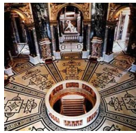
درون موزه تاریخ هنر

این موزه با موزه تاریخ طبیعی وین روبروی یکدیگر قرار داشته و کاملاً متقارن هستند و این اثر طرح مشترک دو معمار «گوتفريد سمپر» 41 و «کارل فن هازن آور» 42 است که برای مجموعه های سلطنتی ساخته شده است. این موزه که در سال 1891 افتتاح شده، یکی از غنی ترین مجموعه های هنری جهان محسوب می شود.