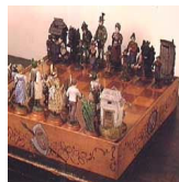
موزه جامعه شناسی

در این موزه می توان با هویت و فرهنگ اقوام اتریشی آشنا شد.