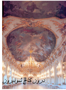
درون کاخ شونبرون

زیباترین و پربهاترین اتاق این کاخ اتاق میلیونی است که دارای مینیاتوری های ایرانی و هندی می باشد.