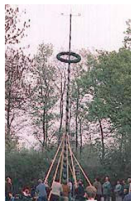
درخت ماه مه

«رقص نوار» که پیرامون این درخت صورت می گیرد و به علت نوارها و رویان های رنگارنگش چنین نامیده می شود، از زمان بین دو جنگ جهانی بسیار محبوب شده است. در مقابل این جشن، مراسم ماه مریم که هدفش