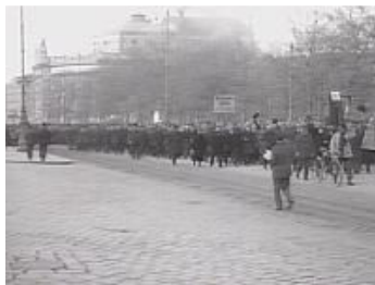
تظاهرات روز کارگر

در سال 1889 کنگره بین المللی کارگران در پاریس صدمین سالگرد انقلاب فرانسه را جشن گرفت در همان زمان نیز روز اول ماه مه سال 1890 به عنوان روز جهانی «پرولتاریات» تصویب و اعلام شد. در این روز تظاهرات، سخنرانی ها و جشن های متعددی بوقوع می پیوندد. گذشته از این در اتریش این روز «روز پرچم» نیز می باشد که نشانگر تصویب اعلام بیطرفی دائمی اتریش توسط شورای ملی در سال 1955 می باشد.