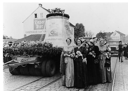
حمل پومرین از لیبز به وین، 25 آوریل 1952

در وین «پومرین» 2 که دومین ناقوس بزرگ جهان است و در کلیسای «شتفانز دم» 3 قرار دارد، به صدا در می آید. این ناقوس حدود 3 متر ارتفاع دارد و حدود 21 تن می باشد. آغاز سال نو در محوطه پیرامون کلیسا با ناقوس «پومرین» و با شامپانی و آتش بازی استقبال می شود.