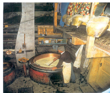
لبنیاتی در فرالبرگ

کشاورزی و صنعت تغذیه در سال های پس از ورود به اتحادیه اروپا شاهد بیشترین دگرگونی ها در نوع خود بوده است و دولت نیز با پرداخت کمک های نقدی سعی بر جبران کسر درآمد این قشر داشته است. این امر بخصوص شامل حال برنامه محیط زیست ÖPUL شده است. پس از ورود اتریش به اتحادیه اروپا کشاورزان و صاحبان صنایع مشابه مجبور به جهت یابی اقتصادی جدیدی شدند. در حال حاضر 70% کشاورزان و 90% اراضی در برنامه محیط زیست ÖPUL شرکت دارند.