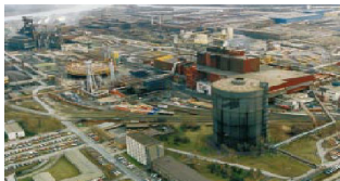
یکی از مدرن ترین کارخانه های فولاد جهان در نزدیکی لینتز

تاریخچه این شرکت به سال 1945 می‌رسد. پس از پایان جنگ جهانی دوم و حکومت ناسیونال سوسیالیستی قسمت اعظم شرکت های اتریشی جزء ملک دولت شد. نقطه ثقل صنایع ملی را منابع و معادنی همچون آهن، فولاد، فلزات، نفت، صنایع شیمیایی و زغال تشکیل می‌دادند. در سال 1970 تمام این شرکت ها تحت پوشش شرکت «هلدینگ» اتریش که صد در صد یک شرکت دولتی بود، قرارگرفت. به علت رقابت اقتصادی شدید در سراسر جهان، دولت اتریش مجبور به سازماندهی مجدد این شرکت شد. در طی پروژه ای دولت اقدام به خصوصی نمودن بخشی از شرکت کرد که البته این پروژه هنوز به اتمام نرسیده است. در طی سال های متوالی دولت شرکت های بزرگی از این مجموعه را فروخت ولی طبق گزارش سال ÖIAG 1999 هنوز 41/1% از دخانیات آستریا، 39/7% از AUA، 38/8% از «فا. آ. شتال. آگ» 27 شرکت سهامی فولاد، 35% از شرکت نفت اتریش ÖMV، 25% از «بوهرلر اودهلم» 28 ، 24% از «فا. آ. تک»، 17/38% از شرکت سهامی فرودگاه وین، کل چاپخانه ملی و کل خانه مزایده وین «دوروتنوم» 29 را در دست دارد.