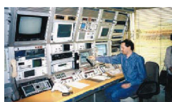
تله کوم آستریا

با آزاد شدن بازار مخابرات در اتریش در سال 1998، شرکت «تله کوم آستریا» 20 نیز مجبور به سازماندهی مجدد شد. در کنار ارزان کردن تعرفه ها، «تله کوم آستریا» خدمات دیگری همچون اینترنت و خطوط دیگر مخابراتی نیز در اختیار مردم می گذارد. در پایان سال 1999 53/2% اتریشی ها دارای تلفن های همراه بوده اند. در حال حاضر در اتریش در کنار «موبیل کوم» 21 که قسمتی از «تله کوم آستریا» است، شرکت های مخابراتی از قبیل «ت. موبایل» 22 ، «وان» 23 و «تله رینگ» 24 نیز فعالند.