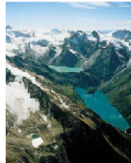
نیروگاه در کوه های سازبورگ

در سال 1998 شورای ملی «قانون سازماندهی انرژی» را تصویب کرد. طبق این قانون حداقل 51% از «شرکت های سهامی اقتصاد برق اتریش» باید در دست فدرال اتریش بماند. 49% دیگر می تواند در اختیار افراد و شرکت های خصوصی قرار گیرد. در سال 1999 بازار انرژی در سطح اتحادیه اروپا گشایش یافت. طبق این پروژه تمام مصرف کنندگانی که بیش از 40 گیگاوات در سال برق مصرف می کنند، حق انتخاب نیروگاه خود را دارند. از فوریه 2003 این حق شامل تمامی مصرف کنندگان با مصرف بیش از 9 گیگاوات نیز می شود. در سال 2008 مصرف کنندگان دیگر با مصرفی بیش از 3 گیگاوات نیز از این حق برخوردار خواهند بود.