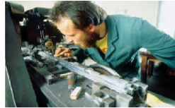
تولید تیپانچه در فرلاح

اتریش در بخش صنعت در بین دیگر کشورهای اروپایی همچنان پیشتاز است. طبق آمار مؤسسه پژوهش های اقتصادی اتریش سهم این کشور در تولیدات صنعتی اتحادیه اروپا از سال 1985 تا امروز از 2/1% به 2/7% افزایش یافته است. با این احتساب اتریش از فنلاند پیش گرفته و به سوئد بسیار نزدیک شده است. دیگر شاخه های اقتصادی که سهمشان در اتحادیه اروپا بیشتر از 5% است، عبارتند از: تولید و صنایع تکثیر صوت و تصویر، وسائل ورزشی، لوازم سمعی بصری، تلویزیون، تکنیک دوربین و ویدئو و قطعات پیش ساخته چوبی. در پی پرسشی که بین مدیر عاملان و سرمایه داران نامی اتریش در سال 1999 انجام پذیرفت، چنین مطرح گردید که جایگاه و ارزش اتریش به عنوان مقر اقتصادی در چهار سال گذشته افزایش یافته است. از جمله عوامل مثبت باید از تبحر کارگران، توسعه و حمایت از شبکه های صنعتی مشترک المنافع (کلاستر 4 ) و کیفیت بالای زندگی در اتریش نام برد، متقابلاً کسورات حقوقی و بوروکراتی در ادارات اتریش جزء نکات منفی محسوب می شوند. همچنین «جامعه اقتصادی جهانی» 5 (WEF) به اتریش از لحاظ کشش رقابت اقتصادی رتبه هجدهم را داده است.